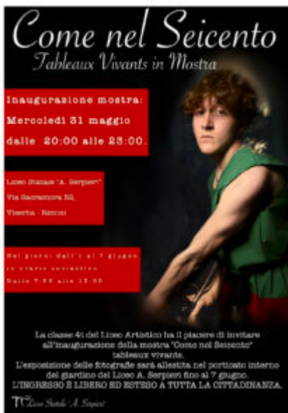
Mostra "Come nel Seicento" tableaux vivants